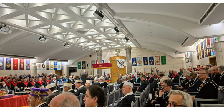
Sessão Anual 2024 no Templo da Grande Loja Nacional da França.

O domingo (08) foi reservado para o regresso das delegações participantes. Às 10h50, horário local, a Comitativa embarcou em Paris, com destino ao Rio de Janeiro, desembarcando no Aeroporto Internacional Tom Jobim, às 18h20, finalizando assim, mais um compromisso e a agenda de atividades 2024 do Supremo Conselho, com excelência. ✍