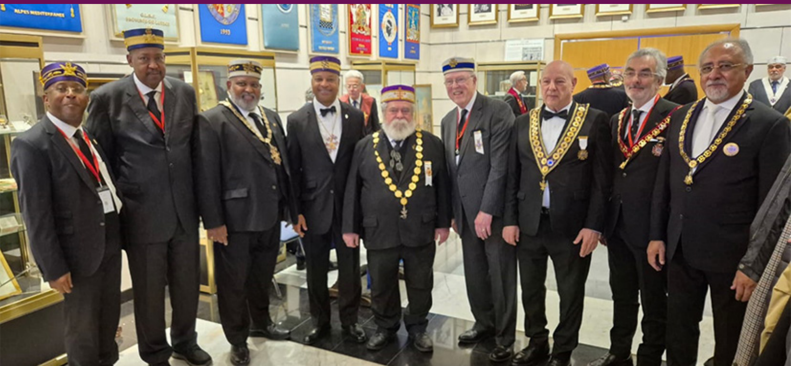
A partir da esquerda, membros da USC PHA, os SSGGCC da Prince Hall EUA Norte, Prince Hall EUA Sul, Brasil, o Representante do SC EUA Sul, SSGGCC Paraguai, Itália e Turquia.

Em 24 de agosto de 1572 aconteceu o “ Massacre da Noite de São Bartolomeu ” promovido pelos reis franceses, que eram católicos, contra os protestantes (huguenotes). As matanças duraram meses e atingiram várias cidades francesas.