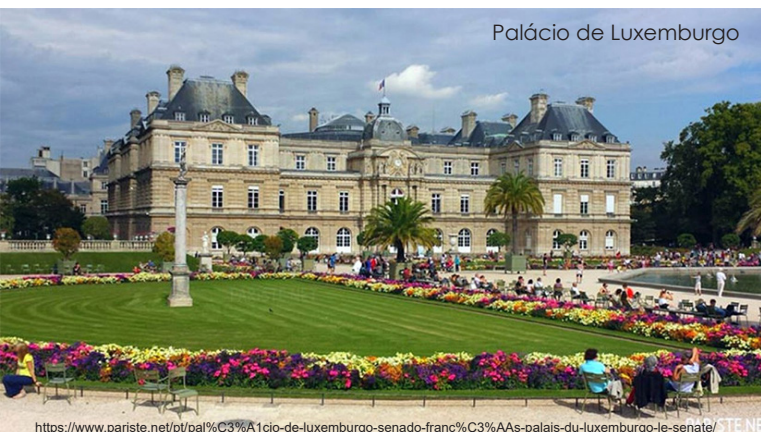
Palácio de Luxemburgo

O novo palácio, construído em estilo Barroco, superou, em muito, os palácios contemporâneos, e os apartamentos da rainha foram considerados como os mais suntuosos e magníficos que se podiam ver na