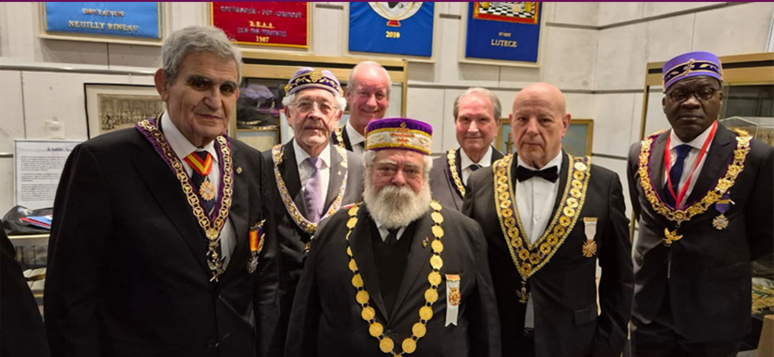
A partir da esquerda, os SSGGCC da Espanha, Portugal, o Chanceler da Espanha, o SGC do Brasil, ME da Espanha, SGC do Paraguai e ME da Costa do Marfim.

parlamento aboliu a monarquia e proclamou a República. Como consequência, em 17 de agosto foi aprovada uma nova Constituição que concedia o poder executivo a um Diretório.