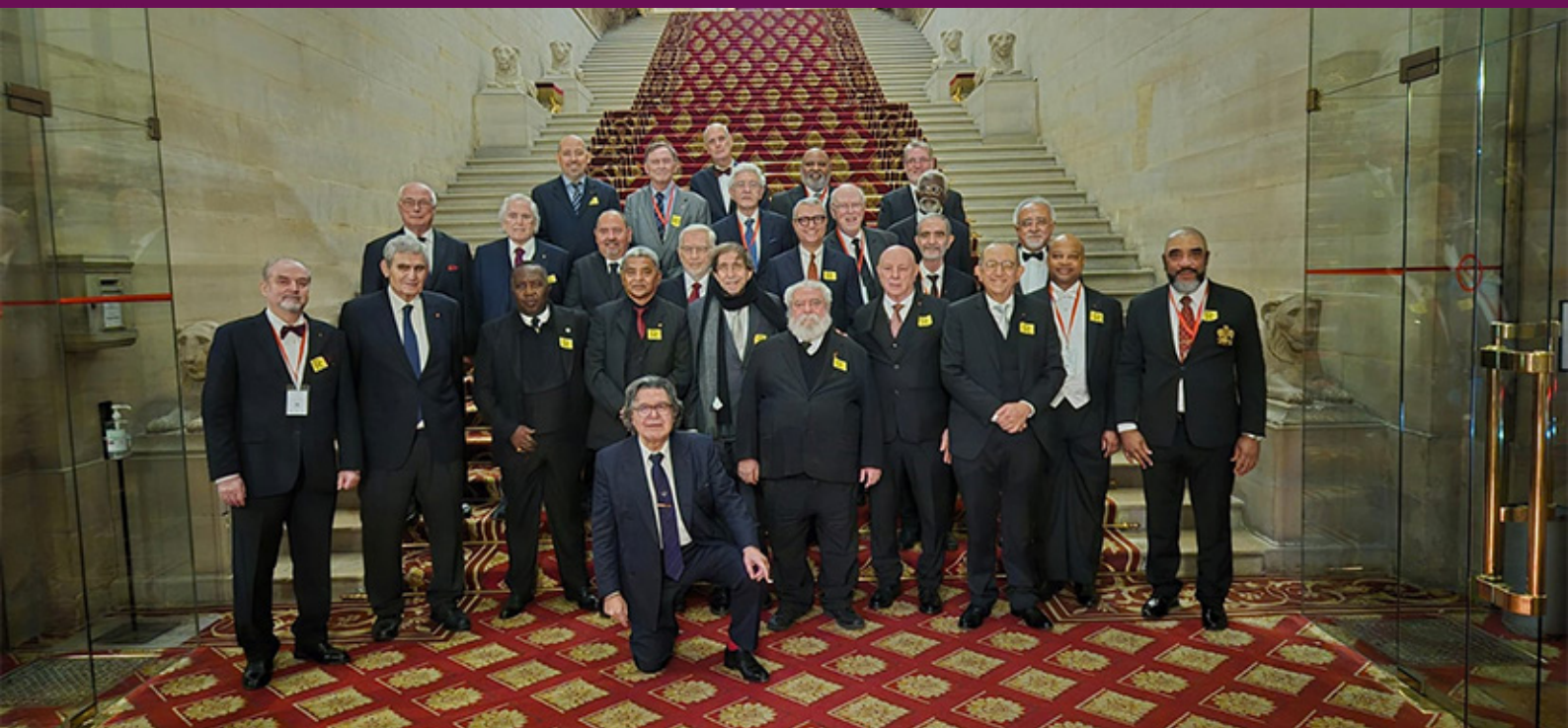
Os Soberanos Grandes Comendadores e Representantes em visita no Palácio de Luxemburgo, quando participaram do Jantar no Restaurante do Senado Francês.

04 de dezembro de 2024, na capital francesa, às 11h50, no Aeroporto Internacional de Paris – Charles de Gaulle, sendo seus membros, fraternalmente, recepcionados por nossos Irmãos do Supremo Conselho Nacional da França e conduzidos ao Hotel Mercure Batignolles, para merecido descanso.