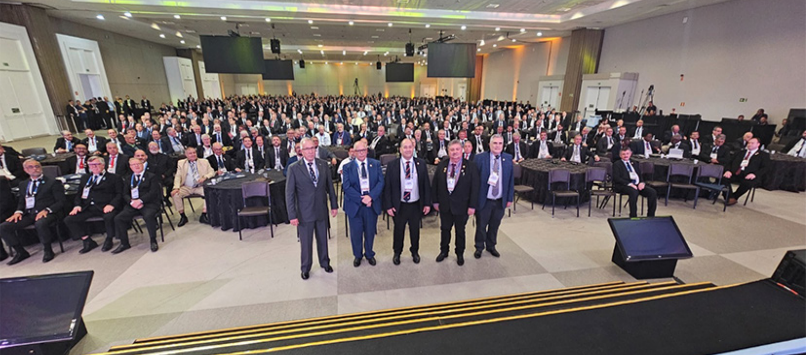
A partir da esquerda, o GM da África do Sul; o GM da GLP (Brasil); o GM do GOP (Brasil); o GM do estado de Andrés Quintano Roo (México); e o GM de Israel.

O Soberano Grande Comendador esteve cumprindo mais um compromisso da vasta agenda de atividades internacionais, na Cidade do México, participando das comemorações do 164º aniversário de fundação do “ Supremo Consejo de Soberanos Grandes Inspectores Generales del Trigésimo Tercer y Último Grado del Rito Escocés Antiguo y Aceptado para la Jurisdicción Masónica de los Estados Unidos Mexicanos ”.