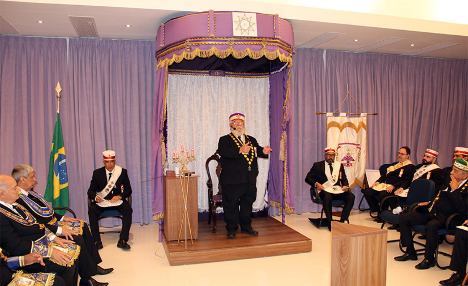
O SGC brindou a todos proferindo uma breve palestra sobre a estrutura administrativa do Supremo Conselho com relação às Potências do Simbolismo.

CPPRS Henrique Edwin Cockel - Vale de Juiz de Fora - 6ª MG (06); CPPRS Paulo Figueira Henriques - Vale de Muriaé - 15ª MG (07); CPPRS Irmão Tomaz Guido Marliere - Vale de Ubá - 16ª MG (01); CPPRS Balduino II - Vale de Salvador - 1ª BA (02); CPPRS Ruy Barbosa - Vale de Ruy Barbosa - 13ª BA (07); CPPRS Encontro dos Rios - Vale de Foz de Iguaçu - 4ª PR (11); CPPRS Delcio Rodrigues dos Santos - Vale de Maringá - 5ª PR (01); CPPRS Lauro Sodré - Vale de Belém - 1ª PA (01); CPPRS Christum Pax - Vale de Porto Velho - 1ª RO (01); e CPPRS Rio Tocantins - Vale de Palmas - 1ª TO (06), totalizando 217 Irmãos, pertencentes a 26 Consistórios, de 09 estados distintos.