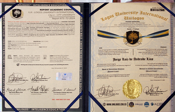
O Soberano Grande Comendador foi agraciado com o título Honoris Causa em Relações Internacionais da Logos University Internacional de Paris – França.

do trono por nosso Irmão, o imperador D. Pedro I, em favor de seu filho, D. Pedro de Alcântara, mais tarde imperador D. Pedro II, fechando o Primeiro Império, iniciando o período regencial no Brasil.