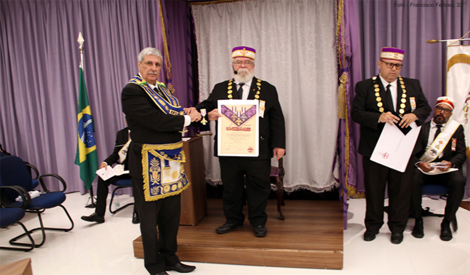
O Soberano Grande Comendador agraciou o Eminentíssimo ex-Grão-Mestre do GORJ, com a honraria Legião de Honra do SC, na categoria Ouro - 15 anos.