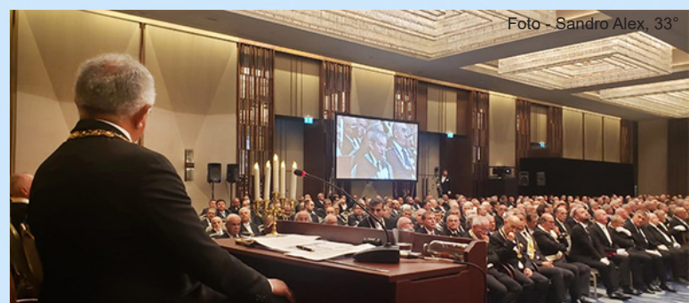
O SGC anfitrião presidindo a Sessão Ritualística da Festa do Rito 2024.

Em 1856, o Capitão Atkinson, um oficial irlandês, alegando possuir um mandado irlandês, criou três Lojas em Izmir e, então, “ A Grande Loja da Antiga e Honorável Fraternidade de Maçons Livres e Aceitos da Turquia ”. Atkinson iniciou cerca de 200 maçons e, então, desapareceu levando o dinheiro dos Irmãos. Em 1862, foi fundada a Grande Loja Provincial da Turquia, em Istambul, pela Grande Loja Unida da Inglaterra, sendo esses Irmãos incorporados.