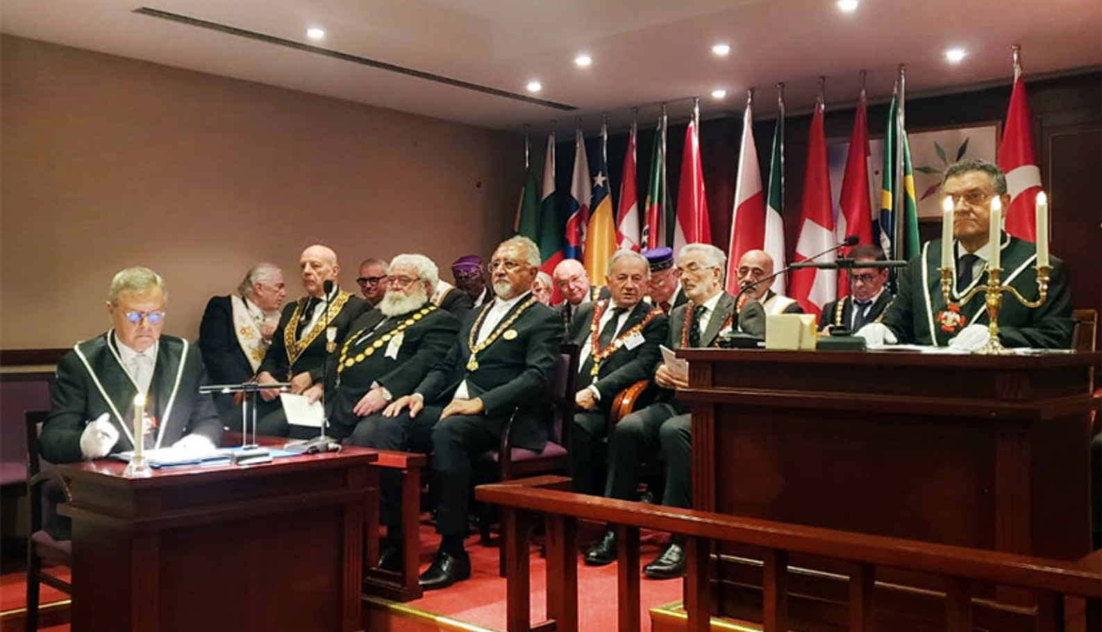
Oriente do Templo composto pelos Soberanos Grandes Comendadores e Representantes na Cerimônia de Iniciação ao Grau 32° - Príncipe do Real Segredo.

Em 1861, foi criado o Supremo Conselho Otomano do Rito Escocês Antigo e Aceito, em Istambul, sendo seu primeiro Soberano Grande Comendador o Príncipe egípcio Halim Pasha, irmão consanguíneo de Khedive - Governador do Egito, então, parte do Império Otomano, tio do Khedive Ismail Pasha, sob cujo governo o Canal de Suez foi aberto. Halim Pasha, também, foi Grão-Mestre da Grande Loja Provincial do Egito. Em 1869, o Supremo Conselho Otomano foi reconhecido pelo Supremo Conselho da Jurisdição Sul dos EUA.