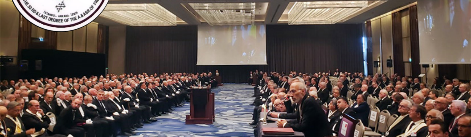
Cerimônia Ritualística Festa do Rito 2024, em Sessão de Grau 4° - Mestre Secreto, no Centro de Convenções do Hotel Hilton Istanbul Bosphorus.

do mundo árabe, contra a Maçonaria, que frequentemente é associada ao odiado Estado de Israel, ao sionismo internacional, aos americanos imperialistas e aos ex-colonizadores anglo-franceses. Tais opiniões, no entanto, são fruto de processos e, principalmente, de propaganda ideológica recente; esse senso-comum, pautado por teorias conspiratórias e maniqueísmo político, não reflete a verdadeira natureza e relação cordial, sensível e profunda que pautou a relação Islâmico-Maçônica na maior parte de sua existência fora da Europa Ocidental”.