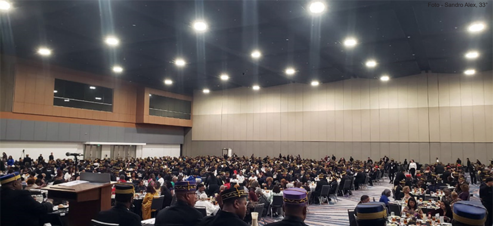
O Jantar de Confraternização reunindo todas as delegações participantes, além dos 274 Irmãos recém investidos, familiares e seus convidados.

Cada um de vocês desempenha um papel crucial neste esforço, e somos profundamente gratos por sua dedicação e apoio (...) ”.