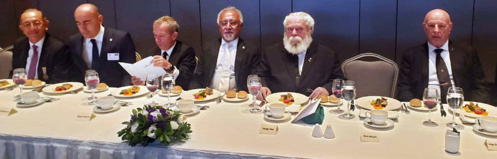
O marcante evento promovido pelo Supremo Conselho da Turquia foi coroado com um Jantar de Gala no Centro de Convenções do Hotel Hilton.

do Supremo Conselho da Turquia. Às 17h, foi realizada uma Sessão Magna de Iniciação ao Grau 32° - Príncipes do Real Segredo, quando foi iniciado 01 Irmão. Às 19h30, foi oferecido um Jantar Fraternal a todos os participantes do evento, em um clima de muita descontração.