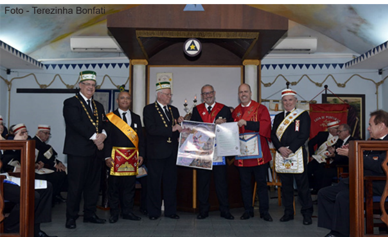
A Excelsa LP Luz e Meditação sendo homenageada pela 1ª Inspetoria de SC.