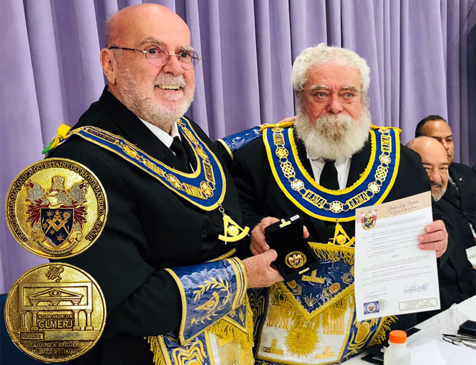
O SGC sendo agraciado pelo Seren.: Grão-Mestre, com uma Medalha da GLMERJ, em reconhecimento pela harmoniosa relação de Amizade entre as instituições.