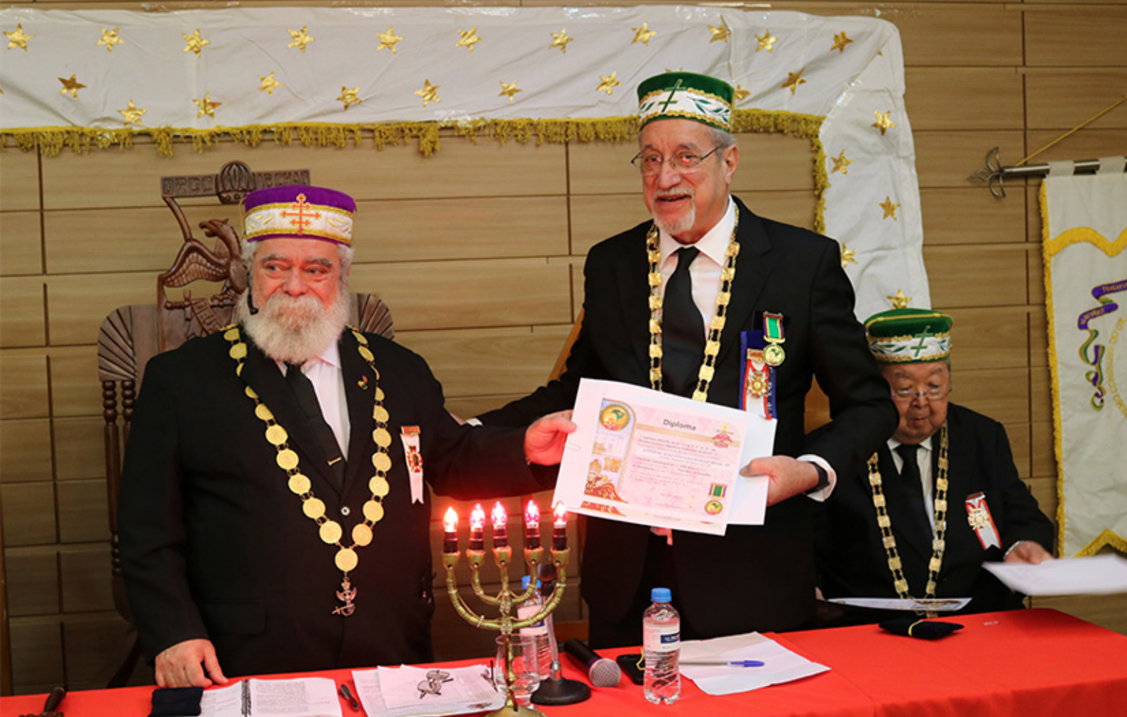
O Soberano Grande Comendador outorga a Comenda, Medalha e os Diplomas alusivos ao aniversário de 195 anos de fundação do SC ao GIL da 11ª SP.

Vale de Uberlândia – 2ª MG (02); CPPRS Templários do Monte Carmelo – Vale de Monte Carmelo – 2ª MG (03); CPPRS Cavaleiros da Liberdade IV – Vale de Alfenas – 10ª MG (07); CPPRS Itamar José de Oliveira Cabral – Vale de Varginha – 10ª MG (01); CPPRS Estrela do Triângulo – Vale de Uberaba – 12ª MG (04); CPPRS Venâncio Igrejas Lopes – Vale de São Luís – 1ª MA (01); CPPRS Firmeza e União – Vale de Dourados – MS (05); CPPRS Miguel Marques de Oliveira – Vale de Três Lagoas – MS (05); CPPRS Adonai – Vale de Campo Grande – MS (02); e CPPRS Dr. Daniel Correa Trindade – Vale de Campo Grande – MS (01), totalizando 162 Irmãos.