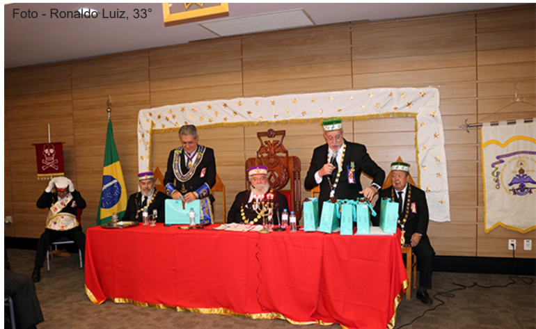
O GIL da 11ª SP entrega um mimo ao GM da GLESP, ao SGC e aos membros de sua Comitiva.