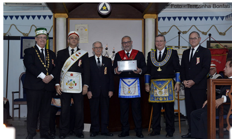
A Excelsa LP Luz e Meditação sendo homenageada pela 2ª Inspetoria de SC.